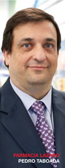
FARMACIA LÁZARO PEDRO TABOADA